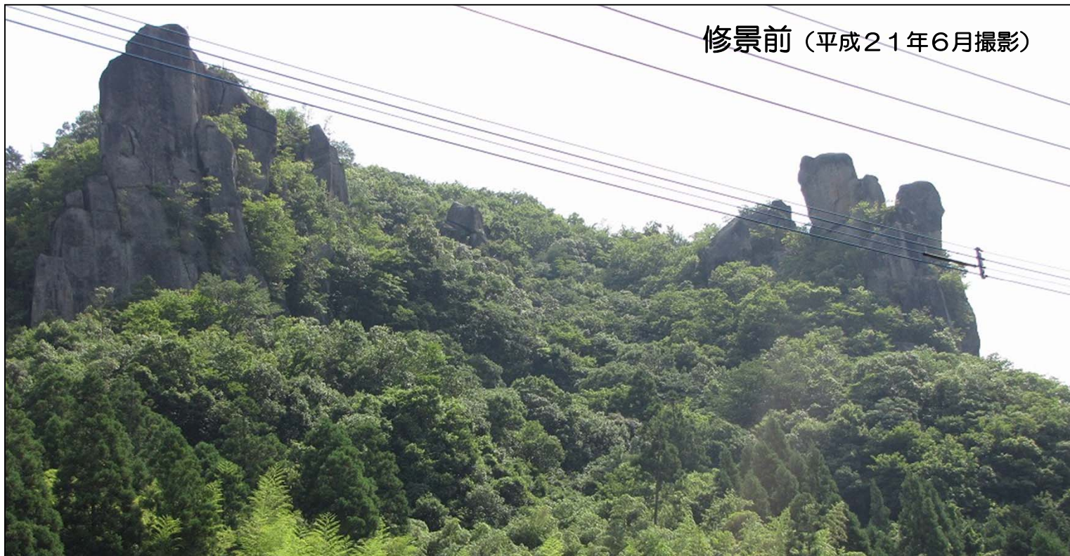
修景前（平成21年6月撮影）