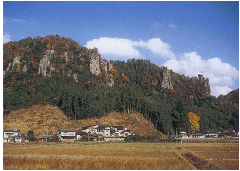
伊福の景（「名勝耶馬溪」66景より）

この度、地元住民のみなさんのご協力と地権者の方々のご理解をいただき、「名勝耶馬溪」の修景が実施され、指定当時の姿を再生することができました。