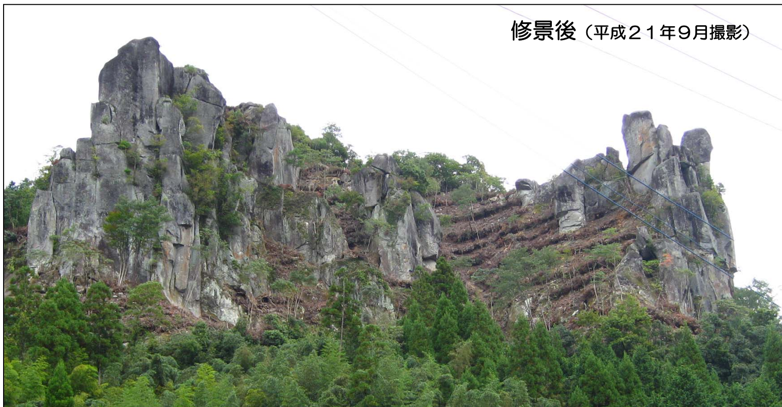
修景後（平成21年9月撮影）