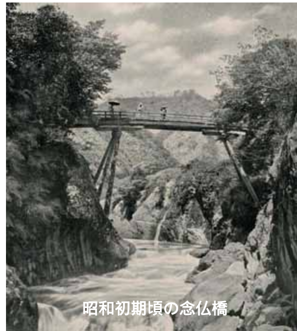
昭和初期頃の念仏橋

この度、地元住民のみなさんのご協力と地権者の方々のご理解をいただき、「名勝耶馬溪」の修景が実施され、指定当時の姿を再生することができました。