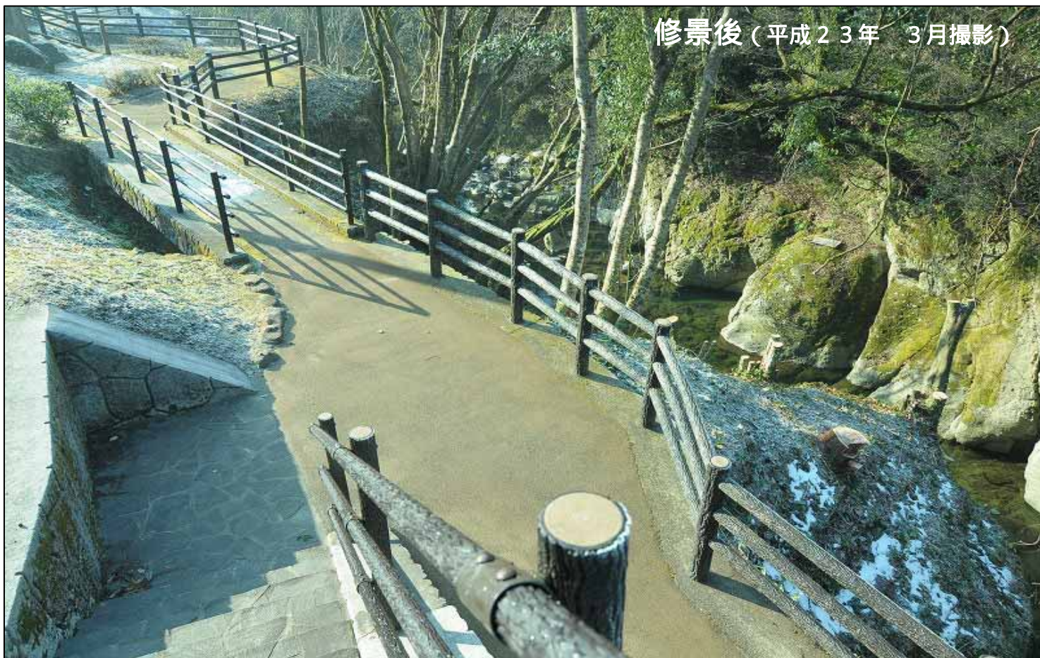
修景後（平成23年 3月撮影）