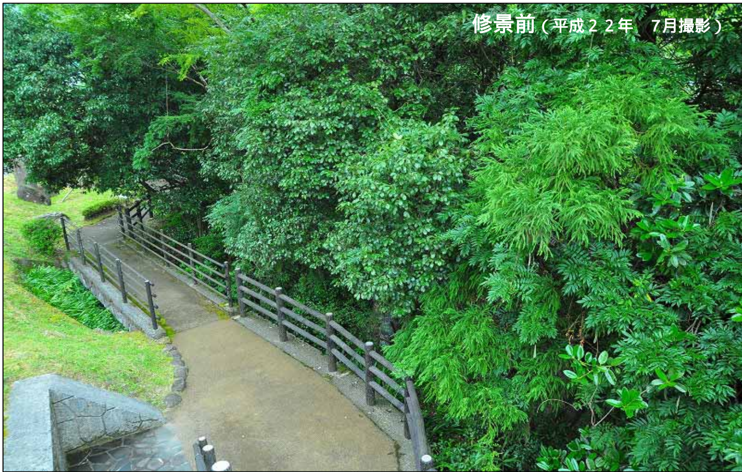
修景前（平成22年 7月撮影）