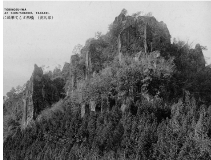
昭和初期の鳶巣山（名勝耶馬溪五十勝より）

この度、地元住民のみなさんのご協力と地権者の方々のご理解をいただき、「名勝耶馬溪」の修景が実施され、指定当時の姿を再生することができました。