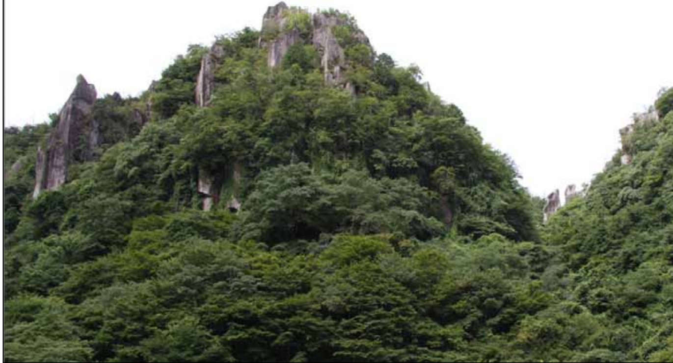
修景前（平成22年7月撮影）