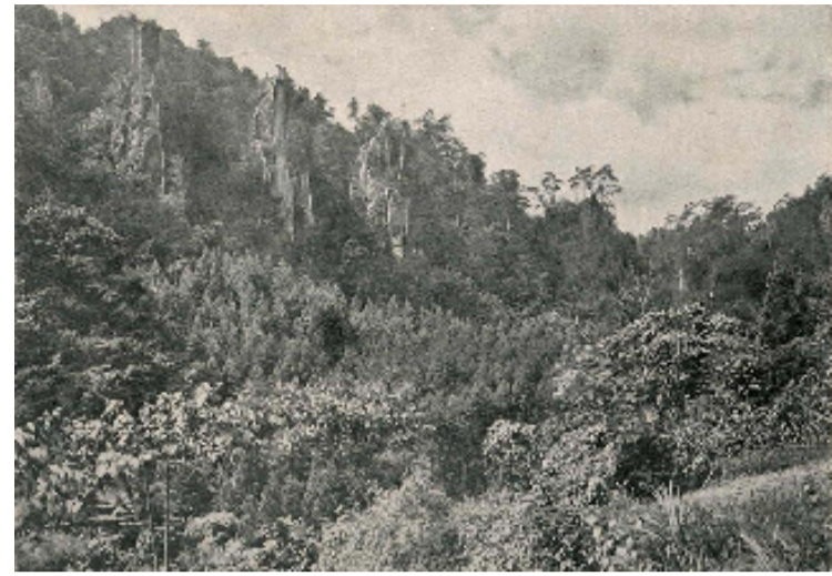
大正～昭和初期の七福岩（耶馬溪写真帳より）

この度、地元住民のみなさんのご協力と地権者の方々のご理解をいただき、「名勝耶馬溪」の修景が実施され、指定当時の姿を再生することがで