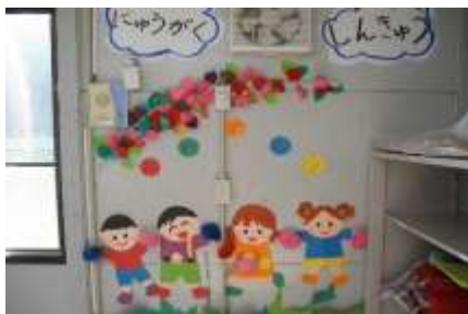
(おめでとう壁掛け)