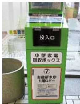
小型家電 回収ボックス