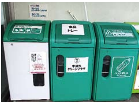
食品トレイ、牛乳パック エコステーション

中津市クリーンプラザでは、「資源ごみ」の一部を回収ボックス(ミニエコステーション)により拠点回収しています。「資源ごみ」には、「食品トレイ」、「牛乳パック」、「ペットボトル」、「小型家電」などがあり、それぞれの回収ボックスを設置しています。設置場所は、協力を頂いているスーパーや公共施設等に設置しています。新たに回収ボックス(ミニエコステーション)の設置を希望するお店(団体)又は施設管理者がいましたら、中津市クリーンプラザ(清掃管理課)までお問い合わせください。