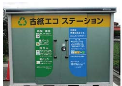
古紙 エコステーション