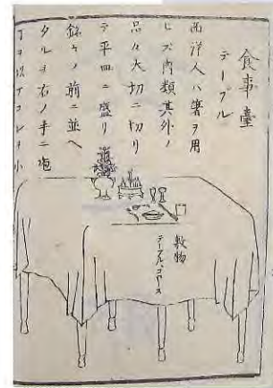
『西洋衣食住』 (福澤記念館所蔵)