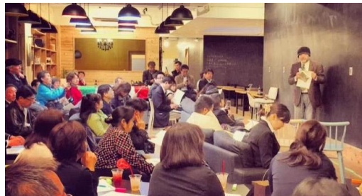
人材育成セミナー