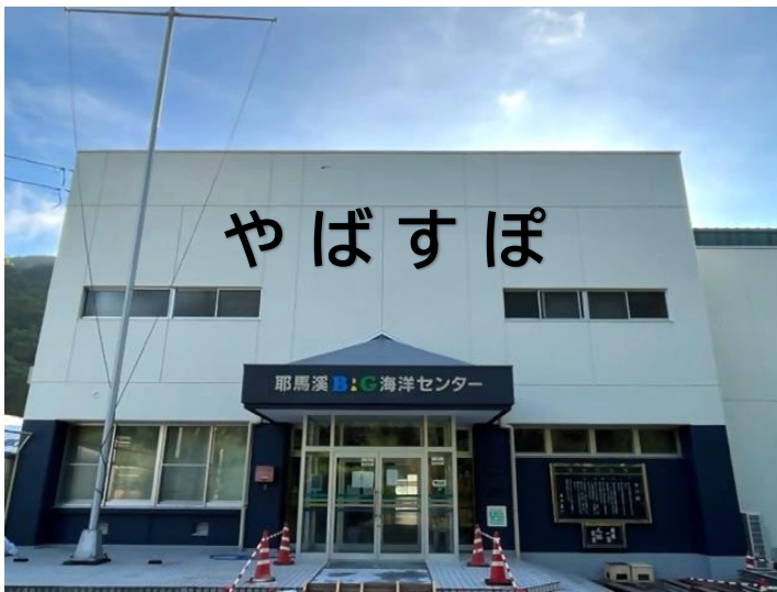
外観イメージ（正面玄関）