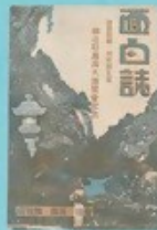
⑤ 国技館で開かれた 世紀の耶馬溪博覧会!