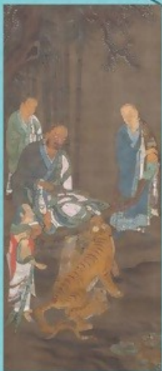
① 実業家の手に渡り、焼失を免れた羅漢寺旧蔵の名品