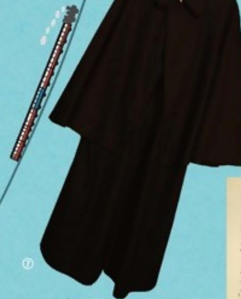
⑦ 文豪・田山花袋と画師・小杉放菴、 「耶馬溪紀行」を執筆