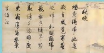
④ 耶馬溪鉄道の敷設に尽力した 和田豊治の遺愛品