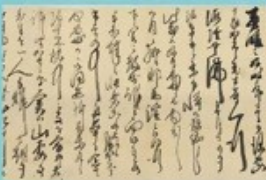
② 福澤諭吉、愛息と耶馬溪に遊ぶ 競秀峰を買い、景観を守ることを決意