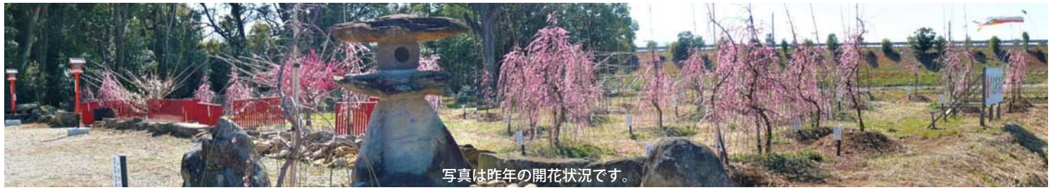
写真は昨年の開花状況です。

●式典・祭事はコロナウィルスの感染状況により緊急中止となる場合があります、あらかじめご承知おきください。