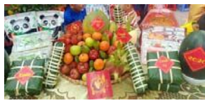
▲テトのちまきと果物