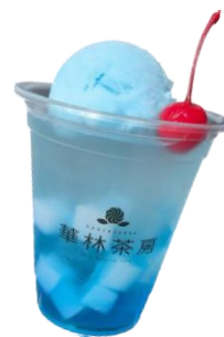
▲水星のソーダフロート